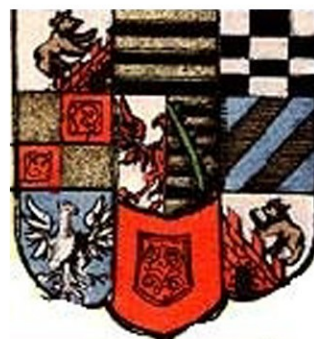
Wappen derer von Plötzkau